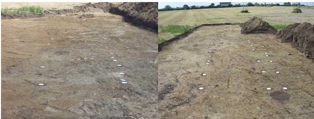
Fig. 13: Til venstre Hus CA (fra vest), til højre hus CB (fra øst)

Hus CA: 16 x 4 m stort hus med tagbærende vægstolper. Huset dateres, ud fra stolpehullernes rektangulære form og husets konstruktion, til sen vikingetid eller tidlig middelalder.