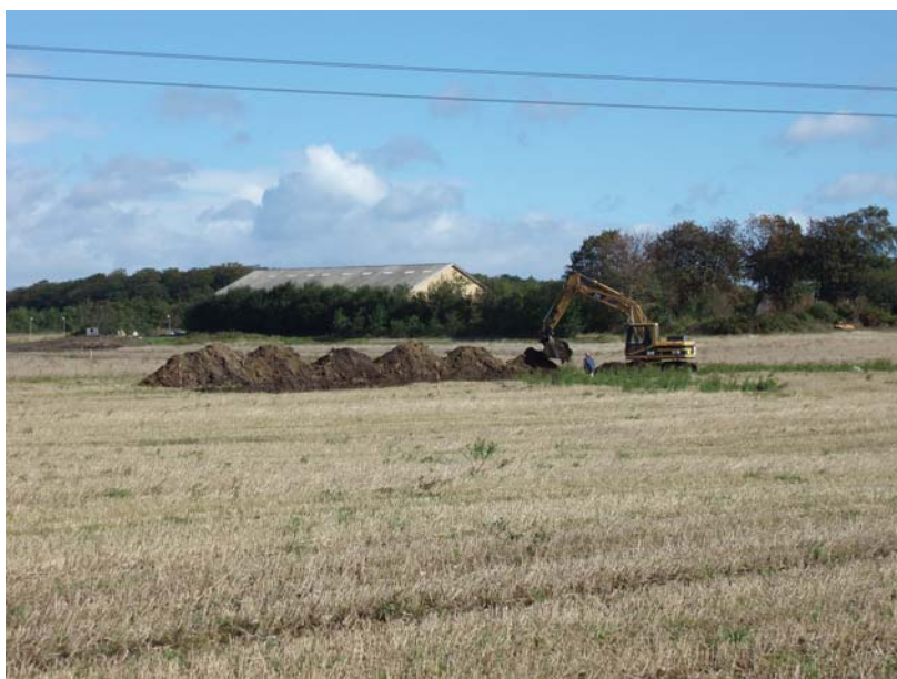
Fig.6: Område 3 under udgravning, fra sydvest

Område 3 på 2631 m 2 lå omkring 300 meter sydøst for område 2 ca. 150 m sydvest for det oprindelige stuehus på Henneberg Ladegård. I området fremkom tre huse samt spredte stolpehuller, gruber, fyldskifter og enkelte kogestensgruber. Husene er ikke endeligt dateret, men da to af dem tilsyneladende er konstrueret med udskud, er en datering til tidlig middelalder plausibel.