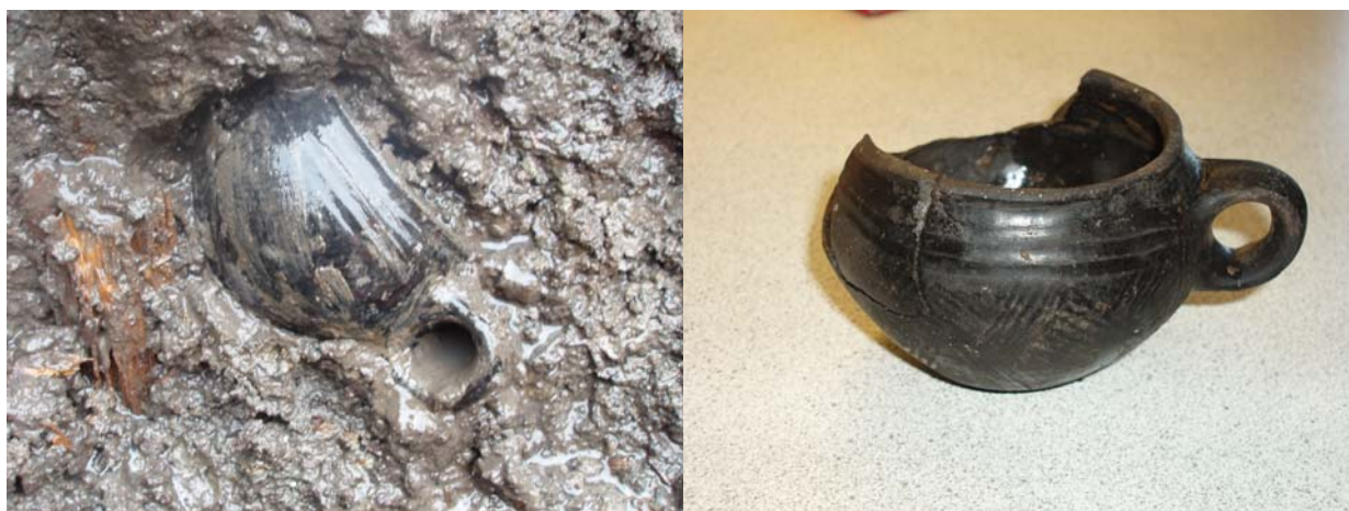
Fig. 17: Til højre lerkar in situ, til venstre det udgravede lerkar.