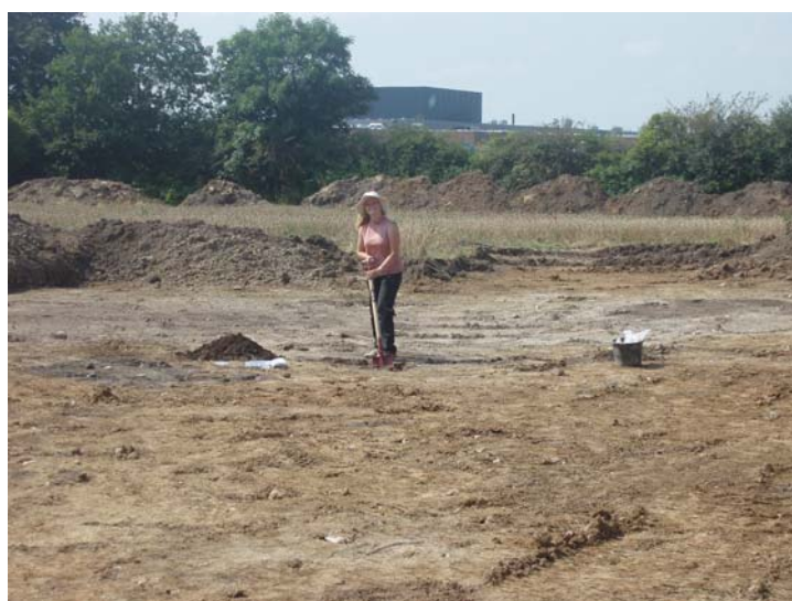
Fig. 18: Anna snitter gruber helt vest i område 2, område 1 i baggrunden, fra øst

Område 2 lå lige øst for område 1. Det bestod af en bakkeknold op mod Dronningens Kvarter, tillige med den sydøstvendte skråning, der løb fra denne ned mod en omkring 300 m bred lavning/engareal, som adskiller bebyggelsen ved Dronningens Kvarter fra bebyggelsen ved Henneberg Ladegård.