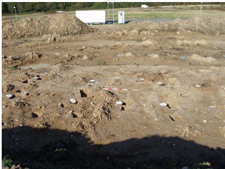
Fig. 12: Hus BAA, fra syd.

Hus BAA: "Treskibet" hus på 9 x 4 m bestående af fire par tagbærende stolper. Centralt i husets nordlige langside sås spor efter indgang, mens der i husets sydlige del fandtes rester efter væglinie.