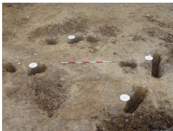
Fig. 9: Staklade BE, fra syd.

Hus BD: "Treskibet" hus på 9 x 4 m bestående af fire par indre tagbærende stolper, samt et fåtal bevarede vægstolper. Keramikfund fra huset daterer dette til ældre romersk jernalder.