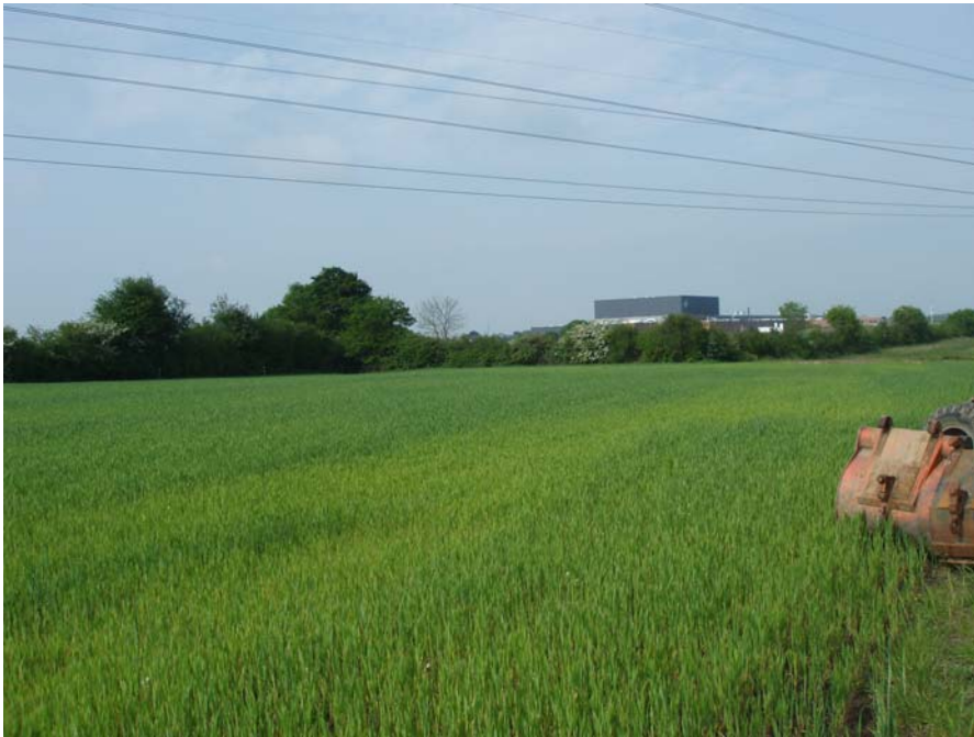
Fig.3: Område 1 og 2 inden udgravningens start, fra øst

Ved undersøgelsen udgravedes et areal på omkring 16.800 m 2 . Udgravningen fordelte sig på tre områder syd for Dronningens kvarter, vest for Henneberg Ladegård. Der blev i alt afdækket 2518 anlæg i form af stolpehuller, gruber, kogestensgruber, brønde og fyldskifter.