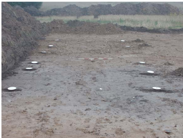
Fig. 10: Hus BL, fra vest.

Hus BL: 22 x 5 m stort hus med tagbærende vægstolper. Stolperne i huset viste stor variation i nedgravningsdybde. Huset er ud fra konstruktion, dateret til middelalder,