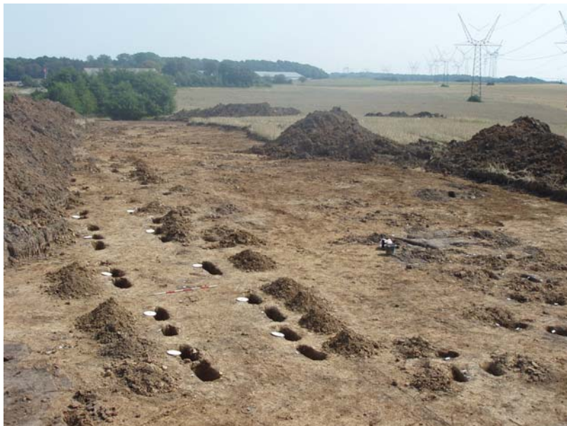
Fig.5: Udsigt fra område 2 mod sydøst.

Bebyggelsen var afgrænset af en fugtig lavning/engareal mod øst. Mod vest er den som før nævnt afgrænset i forhold til område 1 af et mindre, fundtomt område. Mod nord afgrænses bebyggelsen af vejen Dronningens kvarter, mens en senere forundersøgelse af arealet mod syd viste, at bebyggelsen fortsætter ind på det syd-for-liggende areal.