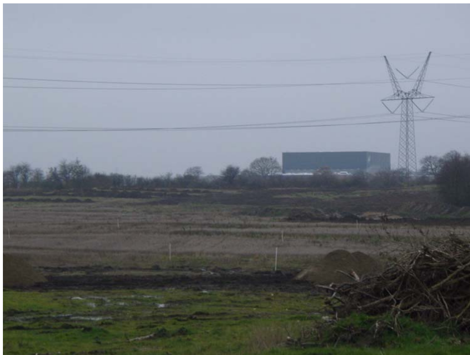
Fig. 19: VKH 7035 Dronningens kvarter til højre i billede, søgegrøfter fra VKH 7087 Kristinebjerg Øst til venstre, fra øst

bebyggelse fra ældre romersk jernalder, førromersk jernalder og bronzealder samt aktivitetsspor fra yngre stenalder herunder enkelgravskultur.