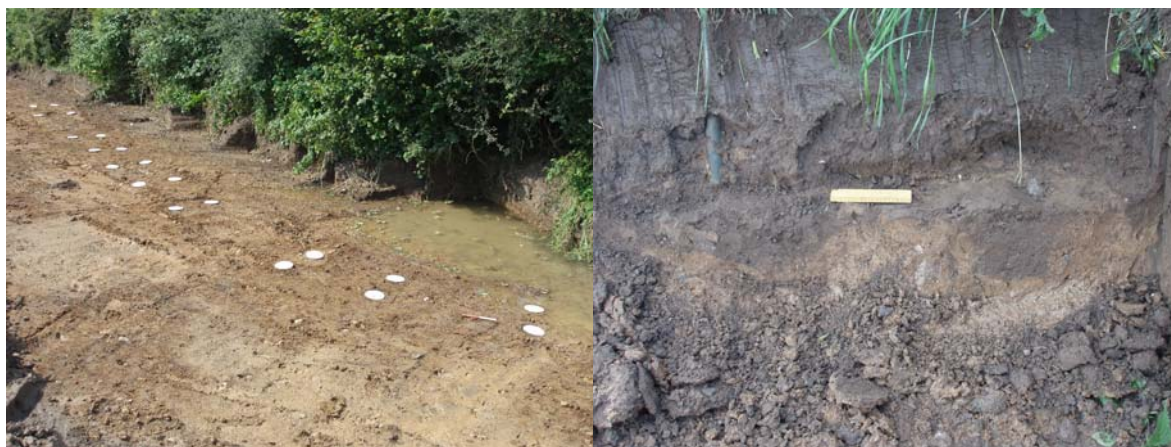
Fig. 7: Til venstre hus AA's østlige væglinie fra nordøst, til højre A 627 og 628 fra hus AA's vestlige væglinie fra nord.

Hus AA: Nord-syd orienteret hus på ca. 19,5 x 5 m. Huset var konstrueret med buede langvægge med dobbelt stolperække i begge sider. Huset ligger i det vestlige skel og blev på grund af dette kun delvis fremgravet. Huset er, ud fra konstruktion, dateret til vikingetid eller tidlig middelalder.