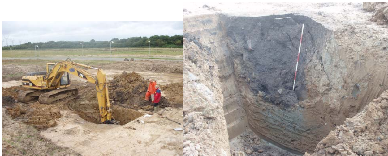
Fig. 15: Til venstre brønd A 1020 under udgravning, til venstre snit af brønd 1020 fra nv.

Omkring den mest koncentrerede bebyggelse i den nordlige del af område 1 op mod dronningens kvarter sås minimum tre separate hegnforløb, der alle omsluttede et eller flere huse i dette område. Efter yderligere analyser er det således sandsynlig, at egentlige gårdsanlæg kan udskilles.