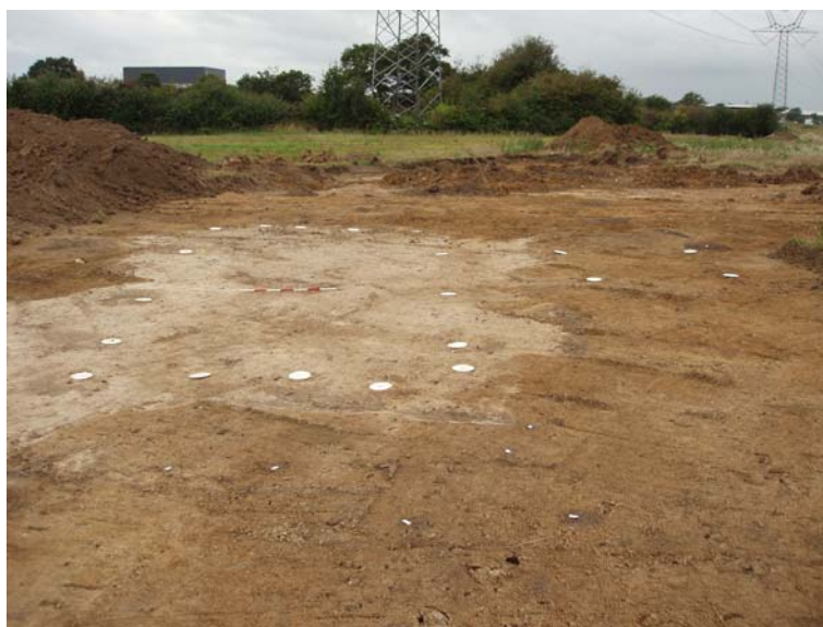
Fig. 11: Hus BT til venstre og staklade BY til højre, fra øst.

Hus BT: 11 x 5 m stort hus – tilsyneladende med tagbærende vægge. I husets østlige gavlside var der efterfølgende opført en tilbygning som forlængede huset med ca. 2,5 m.