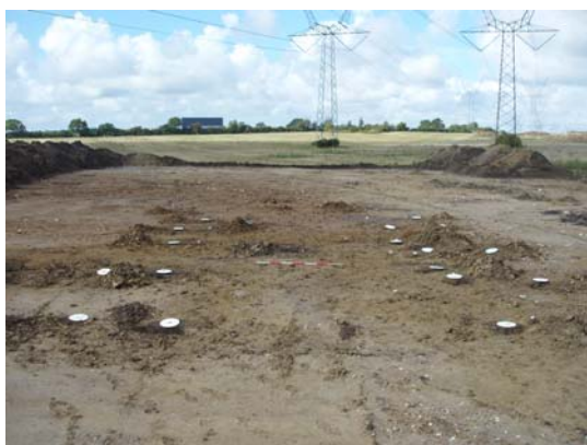
Fig. 14: Hus CC, fra øst

Hus CC: 11 x 7 m stort hus med let buede vægge bestående af to rækker tagbærende vægstolper i hver langside. Huset, som er af Vilstrup typen, dateres til sen vikingetid eller tidlig middelalder(1000-1150 e. Kr.)