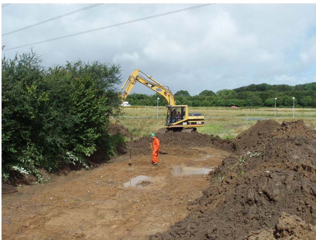
Fig. 4: Michael udgraver område 1, fra syd

Område 1 lå helt mod vest i det undersøgte areal. På området udgravedes et areal på 1200 m 2 , hvorved der fremkom et hus, nogle gruber og et større fyldskifte. Huset daterer sig, ud fra dets konstruktion, til sen vikingetid/tidlig middelalder. Mod syd i område 1 lå en større grube fra yngre stenalder, mens der i områdets nordvestlige del fremkom en samling mindre gruber og fyldskifter fra førromersk jernalder. Område 1 afgrænses i vest af matrikel- og sognegrænse, i nord af et ret fundtomt område op mod den nord for liggende vej, Dronningens Kvarter, mens området mod øst er adskilt fra område 2 ved et ca. 25 m bredt, fundtomt område. Mod syd har en senere arkæologisk forundersøgelse vist, at aktivitetsområdet fortsætter ind på den næste mark.