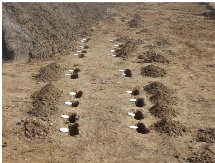
Fig. 8: Hus BA og BB med plader, fra vest.

Hus BB: 13 x 5 m langt "treskibet" langhus, bestående af seks par indre tagbærende stolper. I husets nordlige og sydlige side, lidt forskudt mod øst, fandtes spor efter indgangsstolper. Hus BB og BA lå helt parallelt de tagbærende stolper var forskudt fra hinanden med omkring 0,5 m. Husene har enten været opført straks efter hinanden, eller der er tale om et hus, hvor der i løbet af dets levetid er foretaget en total udskiftning af de tagbærende stolper. Hus BB er tilnærmelsesvis samtidig med hus BA og kan følgelig dateres til ældre romersk jernalder.