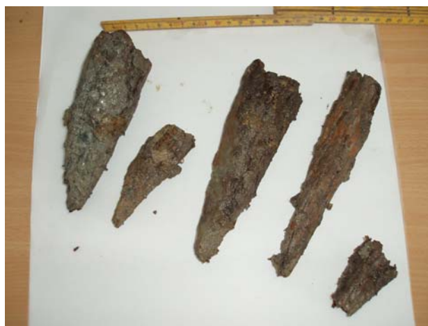
Fig. 16: Tilspidsede pæle fra brønd A 1020

Mellem hus BD og BF fremkom en brønd. Brønden, som i overfladen havde en diameter på 3 meter var i alt 2 m dyb. Nederst i brønden var siderne holdt på plads af tilspidsede træpæle som var rammet ned i dennes bund. De tilspidsede træpæle stod bevaret i en højde af omkring 25 cm. I brønden fremkom der yderligere noget ubearbejdet træ, som i dennes anvendelsestid er faldet eller smidt heri. Brønden er dateret til ældre romersk jernalder omkring 100 e. Kr. ud fra en tilnærmelsesvis hel, ornamenteret lerkop, fundet tæt ved brøndens bund.