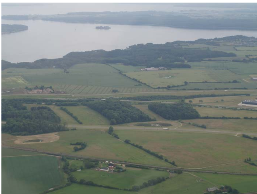
Fig.2: Luftfoto over området fra nord, VKH 7035 Dronningens Kvarter er området med søgegrøfter på