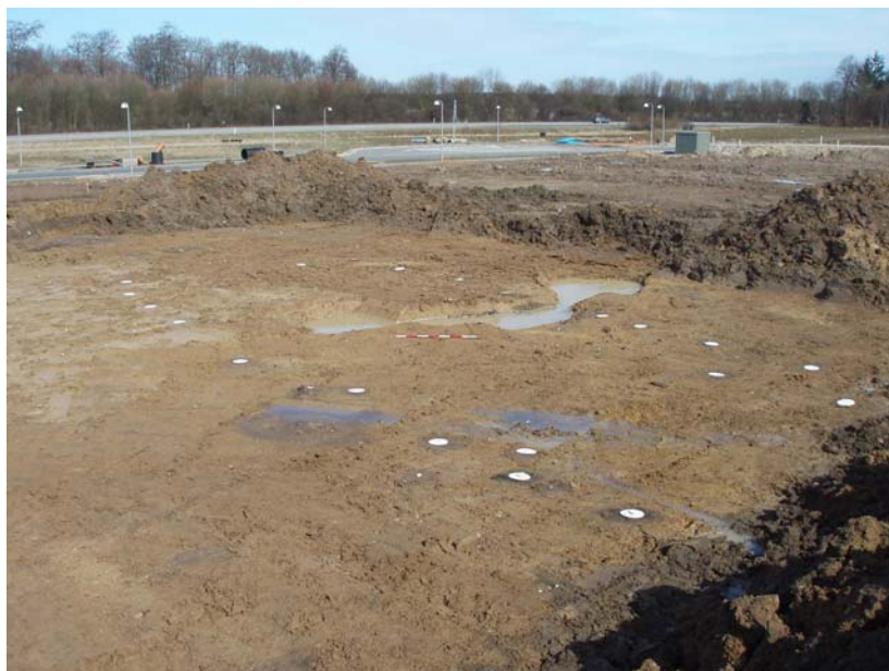
Fig. 13: Hus BD fra sydvest.

Hus BE: Nærmest kvadratisk hus på 8 x 7 m, med tagbærende vægstolper. Formodentlig en form for økonomibygning. Hegnet, som løber ud fra hus BD, løber lige gennem hus BE, som således ikke synes at være samtidigt. Hus BE er ud fra keramikfund dateret til perioden 1300-1250 e. Kr.