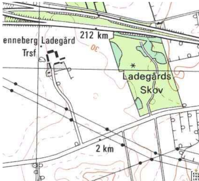
Fig. 1: Lokalteten lå mellem Henneberg Ladegård og Ladegård Skov

Erritsø sogn, Elbo herred, Vejle amt, Stednr. 17.03.02. Kuas journal nr. 2003-2122-1560