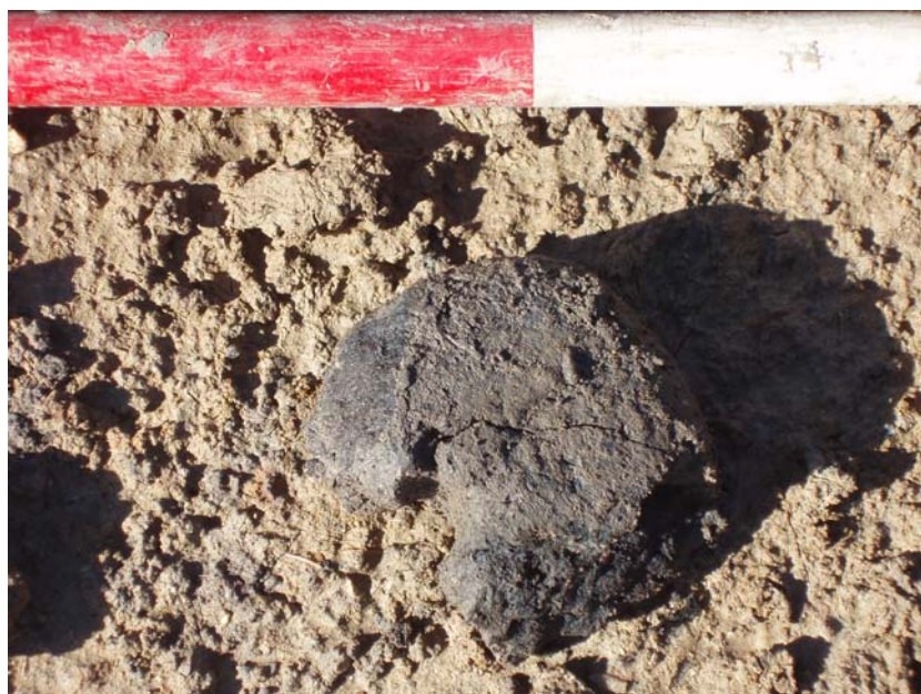
Fig. 12: Vævevægt fundet i stolpehul A1039 hus BB.

Hus BB: Treskibet langhus på 8 x 5 m uden bevaret væglinie. Huset bestod af fire par tagbærende stolper. Flere af stolperne i huset var kvadratiske i planum. I et af stolpehullerne fremkom en – tilnærmelsesvis hel – vævevægt. Huset er, ud fra keramik/vævevægt og stolpernes udformning, dateret til vikingetid eller tidlig middelalder.