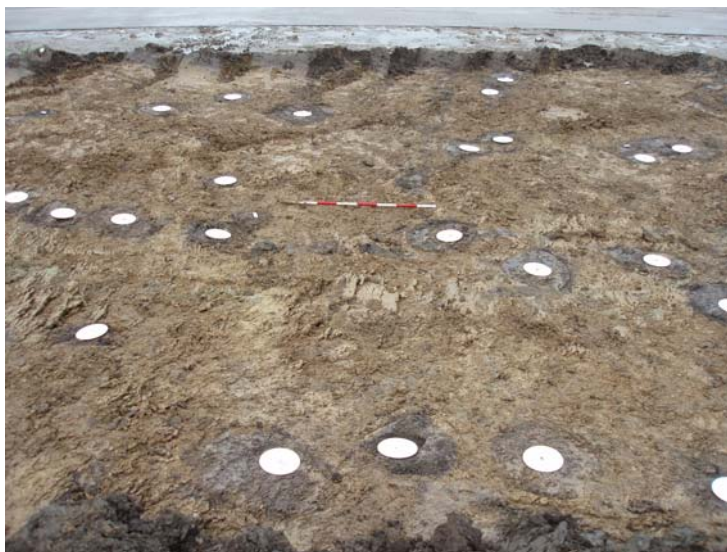
Fig.8: Diverse stolpehuller fra hus AE, AI og AG, set fra vest.

Hus AF: Treskibet langhus på 7,5 x 3,5 m bestående af fire par tagbærende stolper. Huset har samme orientering og konstruktion som hus AD. Det er formodentligt samtidigt med dette og har ligesom hus AD været anvendt som økonomibygning.