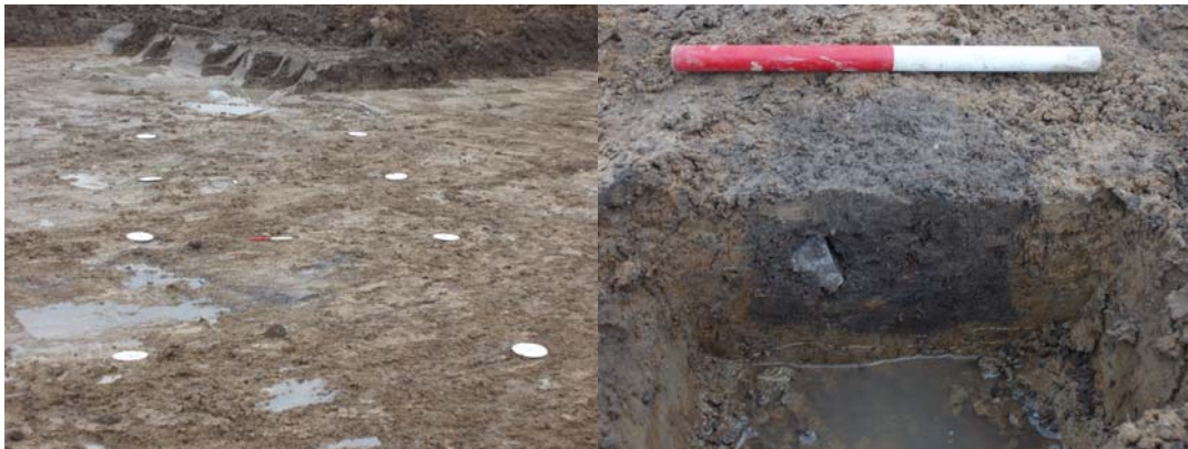
Fig.7: Til venstre hus AD, til højre stolpehul A-636 i hus AD.

Hus AC: 4,5 m bredt og mindst 18 m langt, "treskibet" langhus. Huset, som måske fortsætter udenfor udgravningsområdet mod øst, har fem par tagbærende stolper. Huset er keramikdateret til tidlig middelalder. Fund af lerklining vidner om en konstruktion med lerklinede vægge.