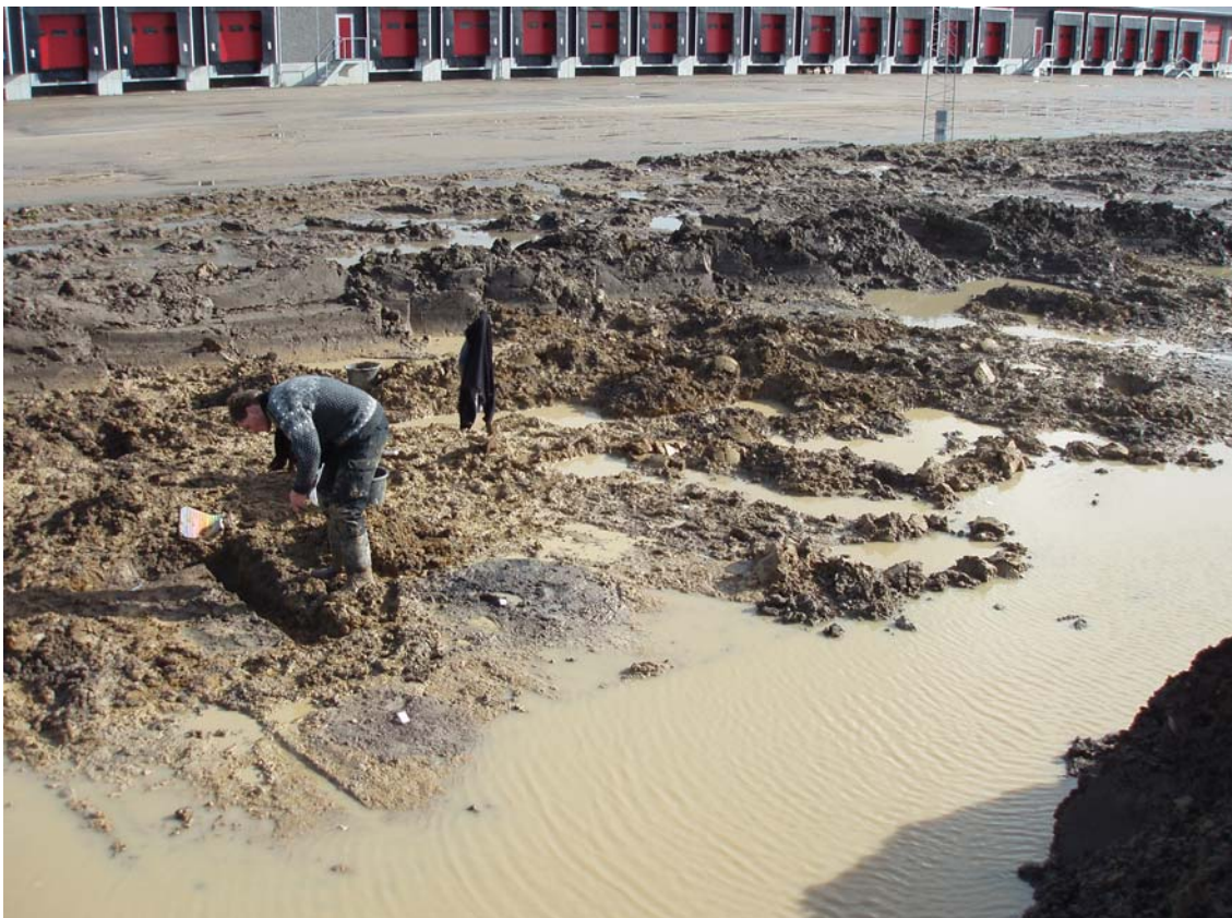
Fig. 4 Morten Jensen udgraver stolpehuller i område 1.

Fundene kategoriserer sig efter antal således: keramik, flinteafslag/redskaber, knusesten, jernslagge, knogler og en flinteøkse.