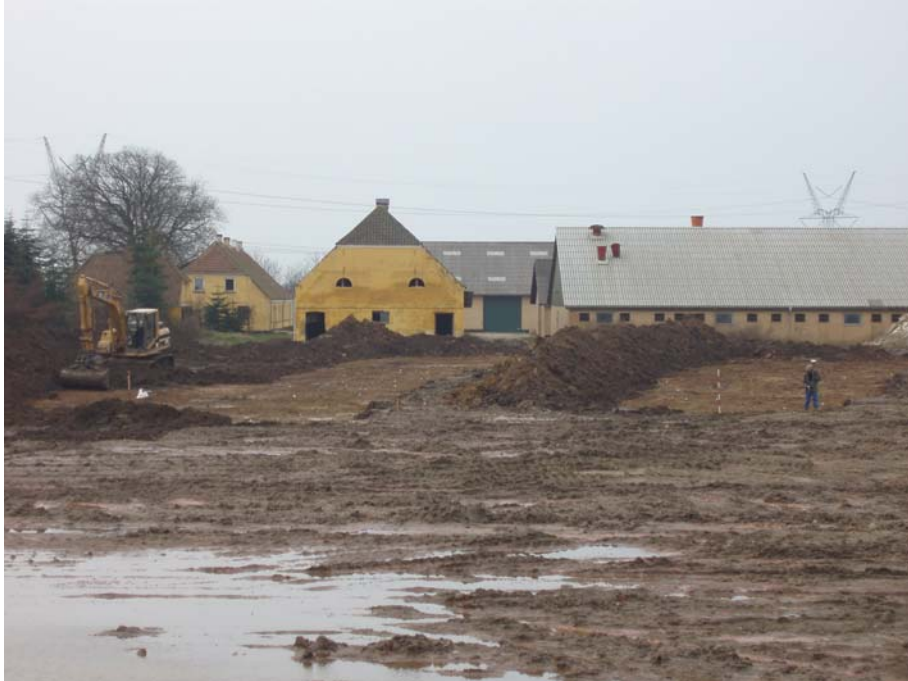
Fig. 6: område 1 set fra øst.

Bebyggelsen er afgrænset af den fugtige lavning mod syd og øst. Mod vest synes bebyggelsen at fortsætte ind under Henneberg Ladegård, uden at det dog var muligt at finde spor af denne på gårdens centrale, ubebyggede gårdsplads. Mod nord afgrænses området af et fundtomt område.