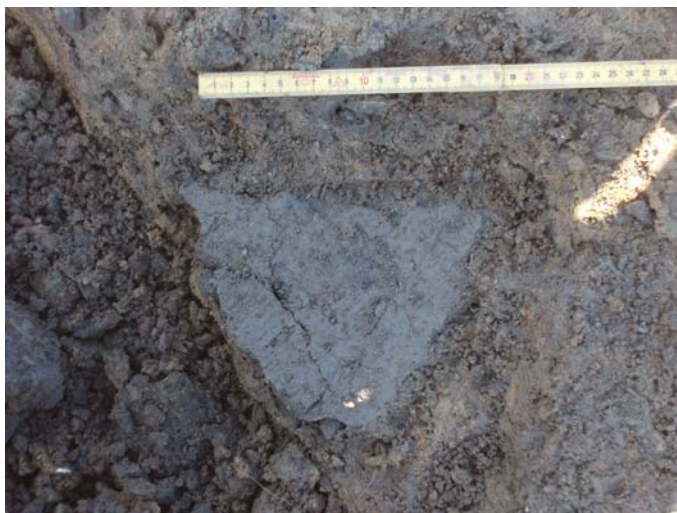
Fig. 11: Basalt kværnsten i Stolpehul A1125 fra hus BA

Hus BB: Treskibet langhus på 8 x 5 m uden bevaret væglinie. Huset bestod af fire par tagbærende stolper. Flere af stolperne i huset var kvadratiske i planum. I et af stolpehullerne fremkom en – tilnærmelsesvis hel – vævevægt. Huset er, ud fra keramik/vævevægt og stolpernes udformning, dateret til vikingetid eller tidlig middelalder.