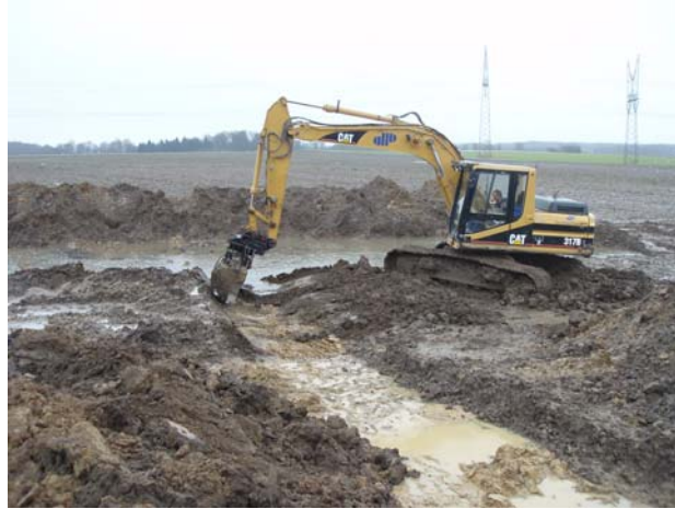
Fig. 3: Vandet voldte en del besvær.

Der blev anvendt 295 fundnumre ved undersøgelsen.