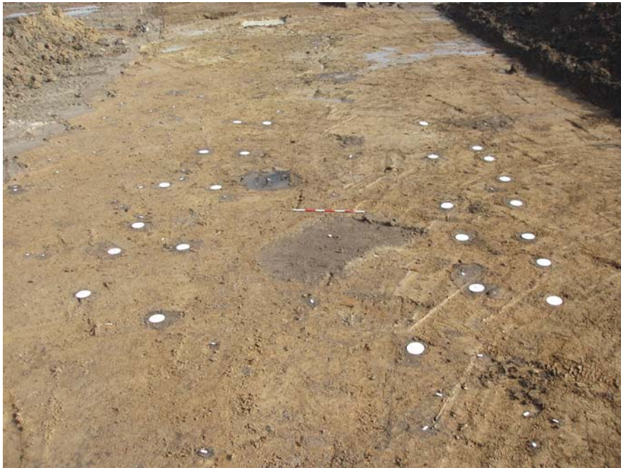
Fig.10.: Østlig del af hus BA, af "Vilslevtype" set fra vest.

Hus BA: 22 x 8,5 m stort langhus af Vilslev-type med let buede, tagbærende vægge. I husets vestlige del fremkom et større område uden såvel vægstolper. Om dette brud i stolperækken er oprindeligt, er ikke afklaret. Hustypen daterer huset til perioden 1000-1150 e. Kr.