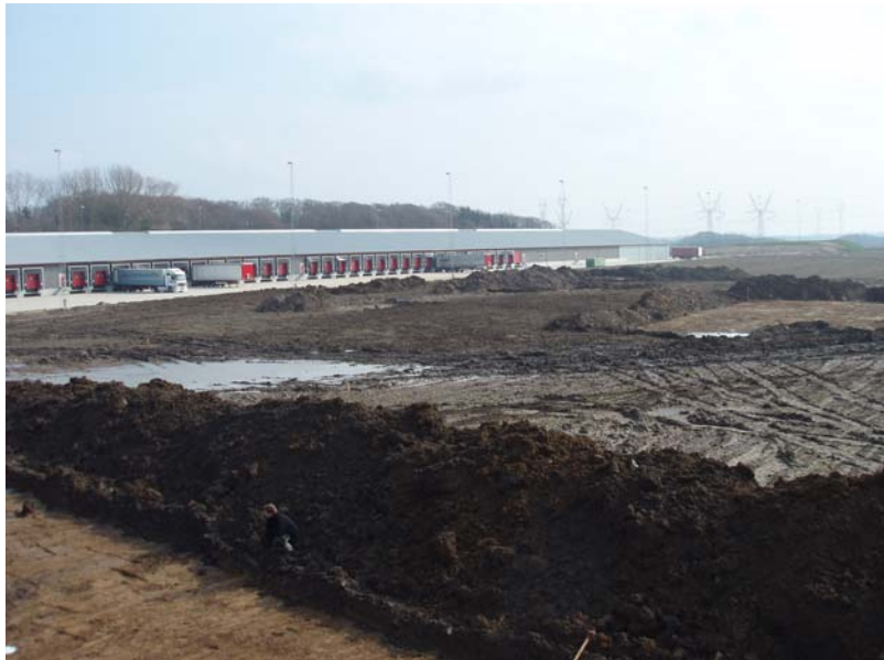
Fig. 5: Område 1 set fra nordvest. Med lokaliteten VKH 7006 Ladegård Skov i baggrunden.

Område 1 lå i den østlige del af det undersøgte areal i forlængelse af det område, som udgravedes ved Ladegård Skov sommeren 2006, Vejle Museum VKH 7006 Ladegård Skov. På området udgravedes et areal på 5500 m 2 , hvorved der fremkom 10 huse og to staklader. Bebyggelsen daterer sig ud fra keramik fundet i enkelte af husene til perioden 1050 til 1300 e. Kr.