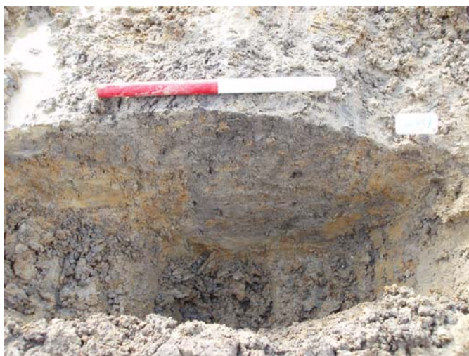
Fig. 9: A 457 hus AE, fra vest.

Hus AI: 9 meter bredt og mindst 22 m langt hus med tagbærende vægge. Huset fortsætter tilsyneladende ind under udgravningsgrænsen mod øst. Det er konstrueret med ret tætstillede vægstolpe. Huset er ud fra konstruktion og den fundne keramik dateret til tidlig middelalder, 1100-1300 e.Kr..