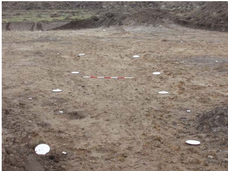
Fig. 15: Hus CA fra øst.

Hus CA: mindre øst-vest orienteret ”treskibet hus” på 8 x 3,5 m bestående af fire sæt tagbærende stolper. Huset er ikke selvstændig dateret, men keramik fra en grube lige nord for huset indikerer en datering til tidlig middelalder – 1000-1200 e.Kr.