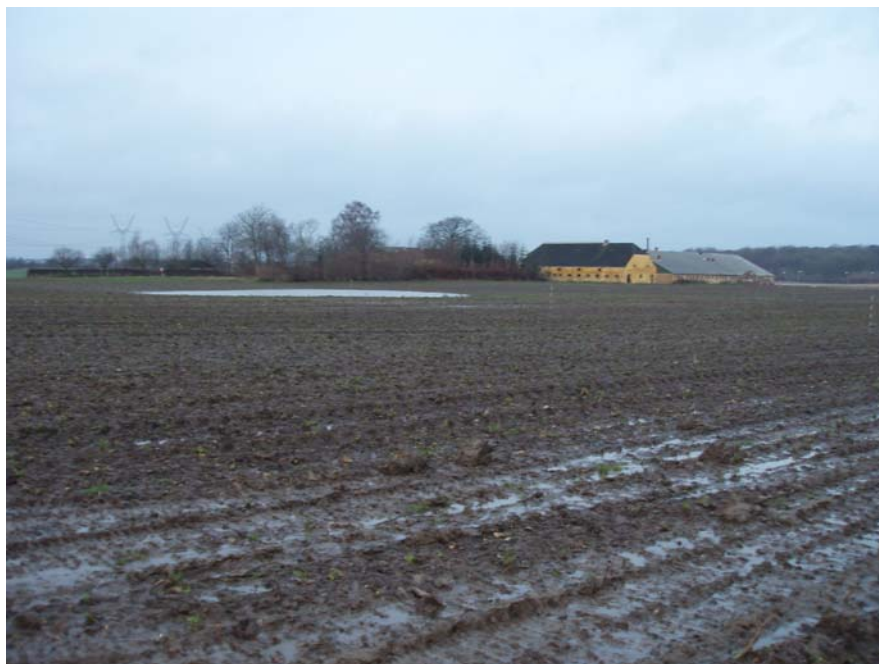
Fig. 2: Området inden udgravning set fra sydøst.