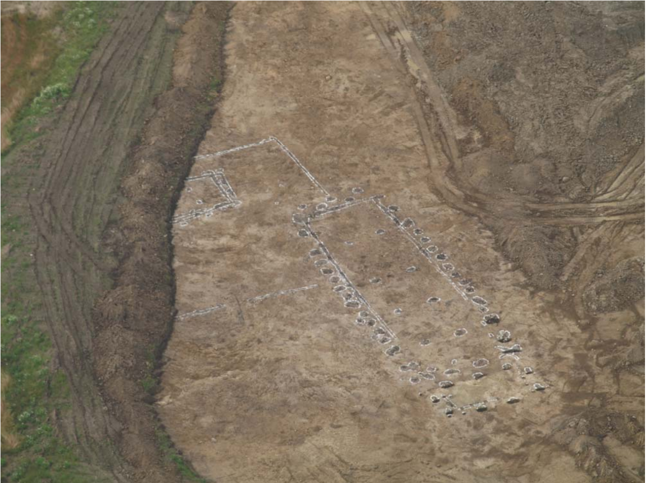
Fig. 3. Hovedbygningen med det mindre hus samt indhegningen set fra ca. sydøst.