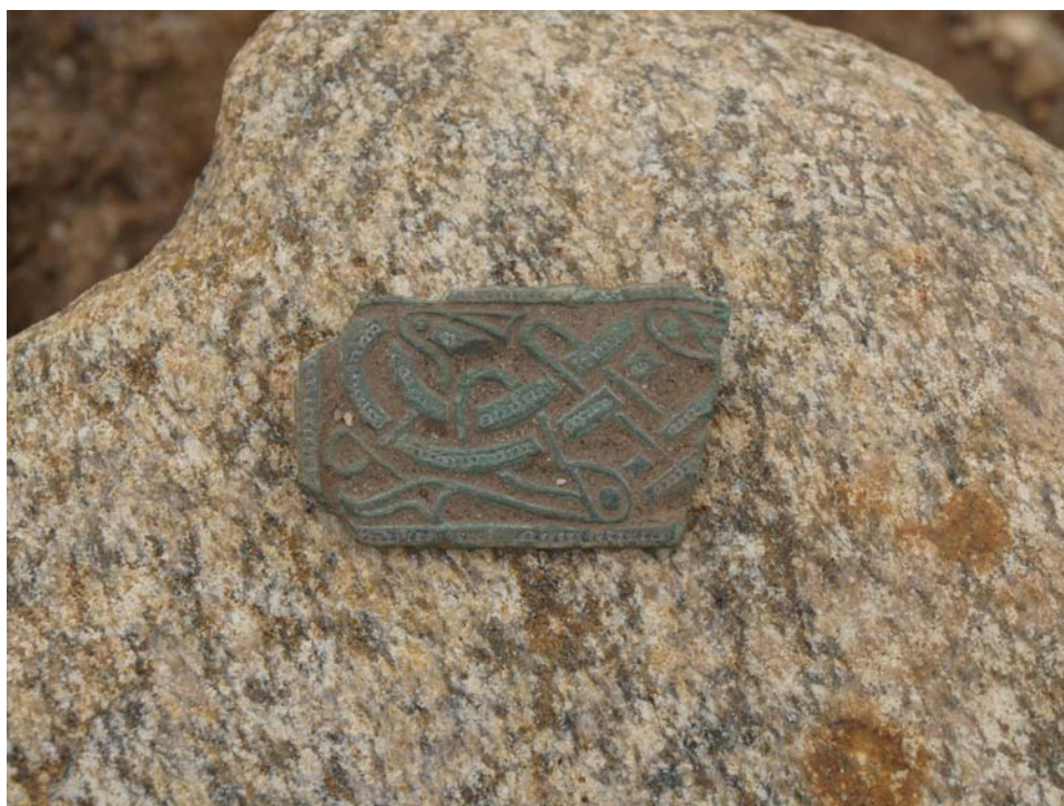
Fig. 6. Den detektorfundne pladefibula umiddelbart efter den blev fundet.