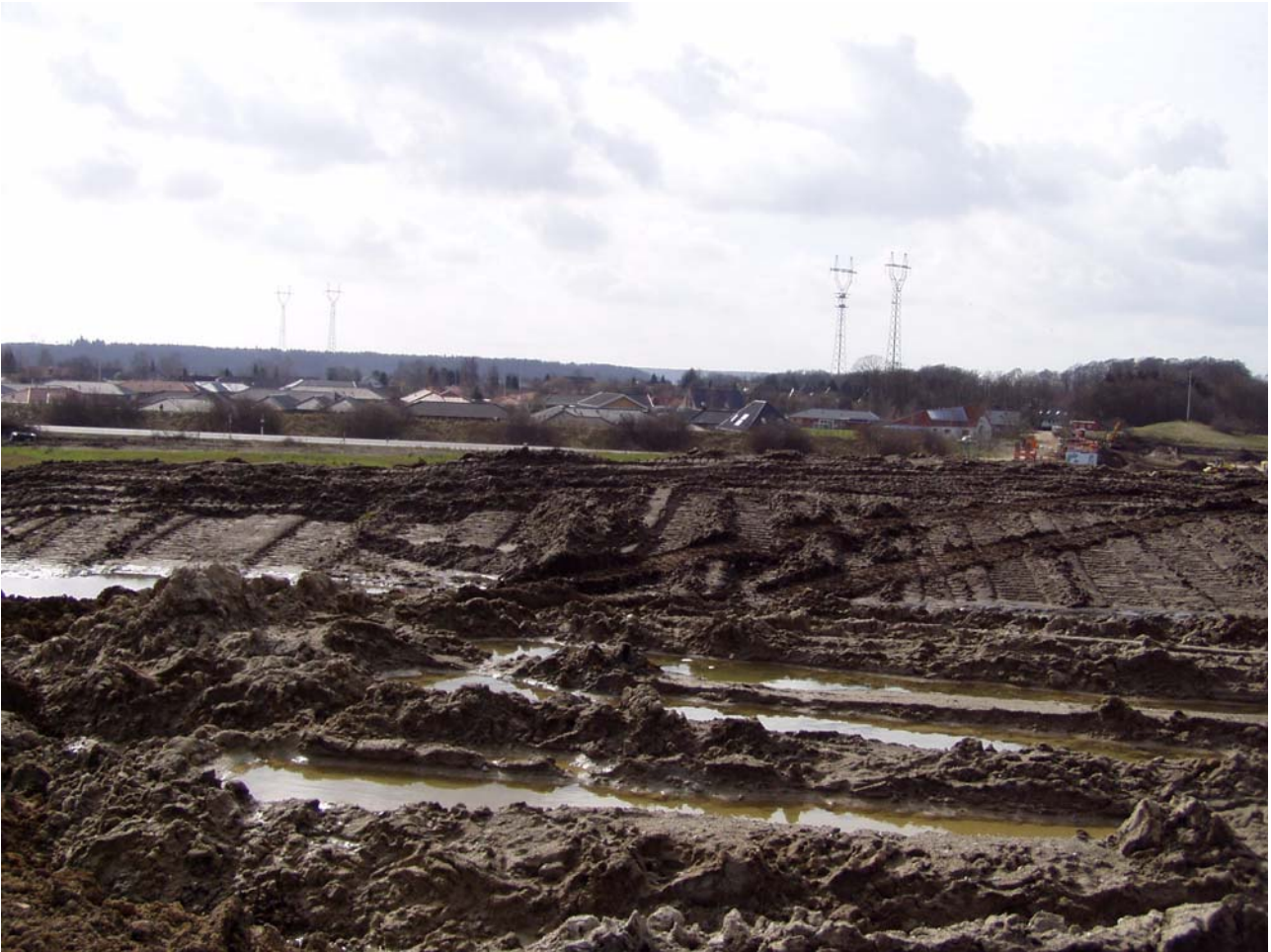
Fig. 2. Området efter entreprenørens afmuldning.