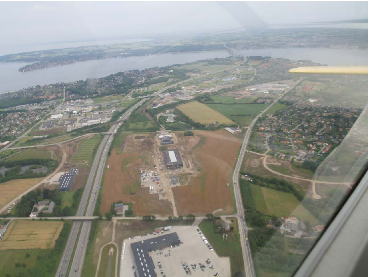
Fig. 7. oversigtsbilledet viser lokalitetens beliggenhed i forhold til Lillebælt