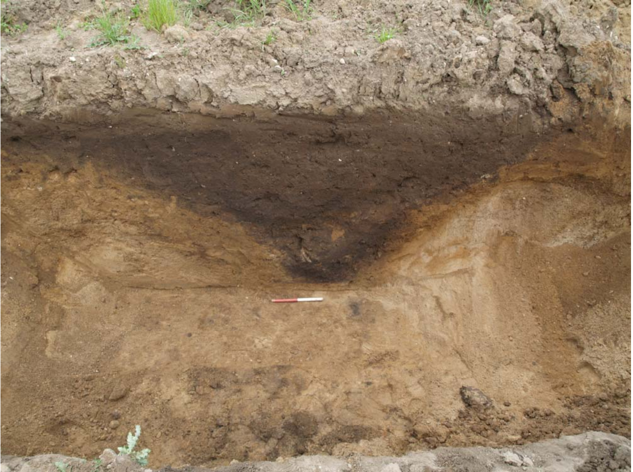
Fig. 4. Snit gennem voldgraven.

Udover de anlæg der med sikkerhed kunne knyttes til storgården undersøgtes dele af et langhus der ikke var samtidige med denne samt et par staklader, der ikke kunne dateres nærmere.