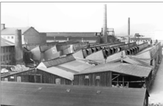
Nr. 2, C.M. Hess fabriksanlæg