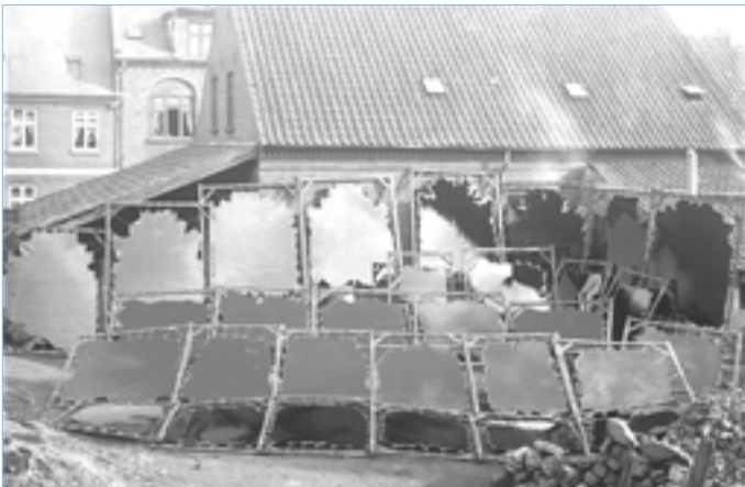
Nr. 5, C.J. Bjerregaards Sønner