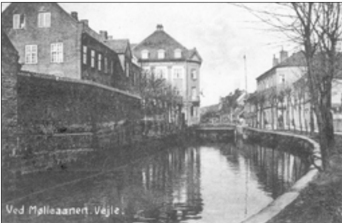
Nr. 14, Mølleåen før den blev overdækket