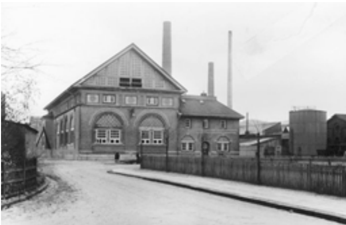
Nr. 3, Vejle Kommunale Elektricitetsværk