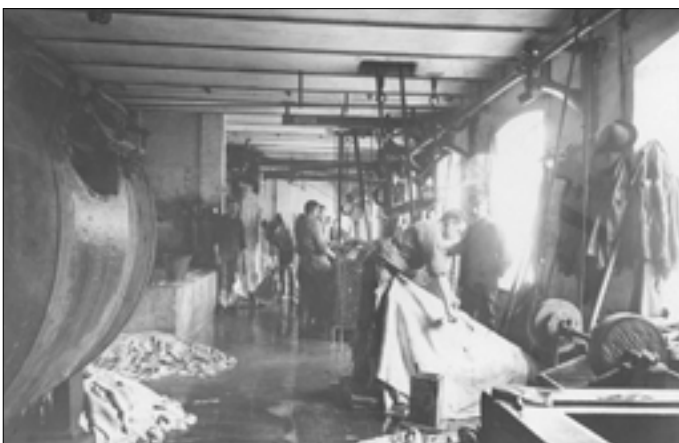
Nr. 6, Garveri, Ballins Sønner