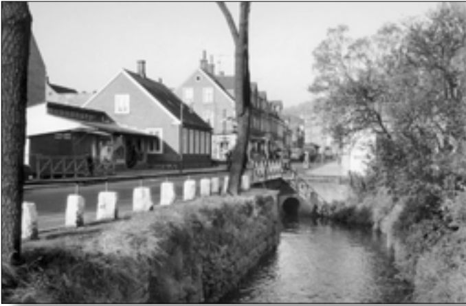
Nr. 4, Vesterbrogade, Omløbsåen