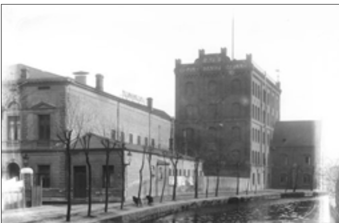
Nr. 15, Vejle Dampmølle, Dæmningen