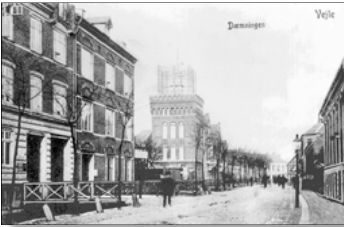
Nr. 13, Dæmningen set mod nord