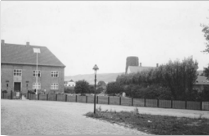
Nr. 1, Vejle Museum