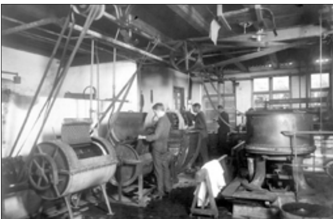
Nr. 12, L.P. Hansen, vaske-, skylle- og farve- maskiner