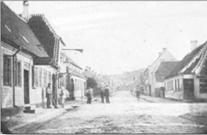
Nr. 7, Vestergade, 1864