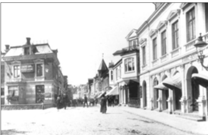
Nr. 9, Nørregade, set fra Nørretorv