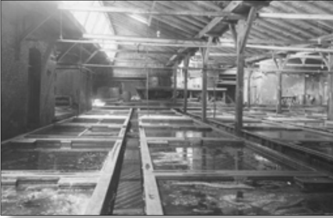
Nr. 16, Vejle Sålelederfabrik