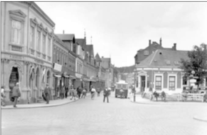
Nr. 8, Nørretorv - Vestergade, 1930-35